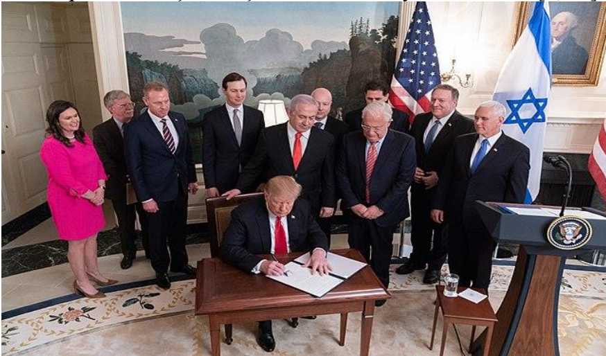
ABŞ prezidenti D.Tramp Colan təpələri üzərində İsrailin suveren hüququnu tanıyır. 25 mart 2019-cu il.

- Prezident D.Tramp 2020-ci ilin yanvarında Fələstin probleminin həlli ilə bağlı yeni sülh planını açıqladı (Plan “Sülh görüşü” və ya “Çiçəklənmə üçün sülh” adlanırdı). Ümumilikdə, İsrailin mənafeyinə uyğun olan bu plana əsasən, İordən çayının Qərb sahilinin 30%-i və İordaniya vadisinin mütləq əksəriyyəti Qüdsün böyük hissəsi daxil olmaqla İsrailə verilməli, Qəzza sektoru və İordən çayının Qərb sahilinin 70%-ni əhatə etməklə və Əbu-Dis və ya Şərqi Qüds paytaxt olmaqla hərbsizləşdirilmiş Fələstin dövləti yaradılmalı idi [9; 10].