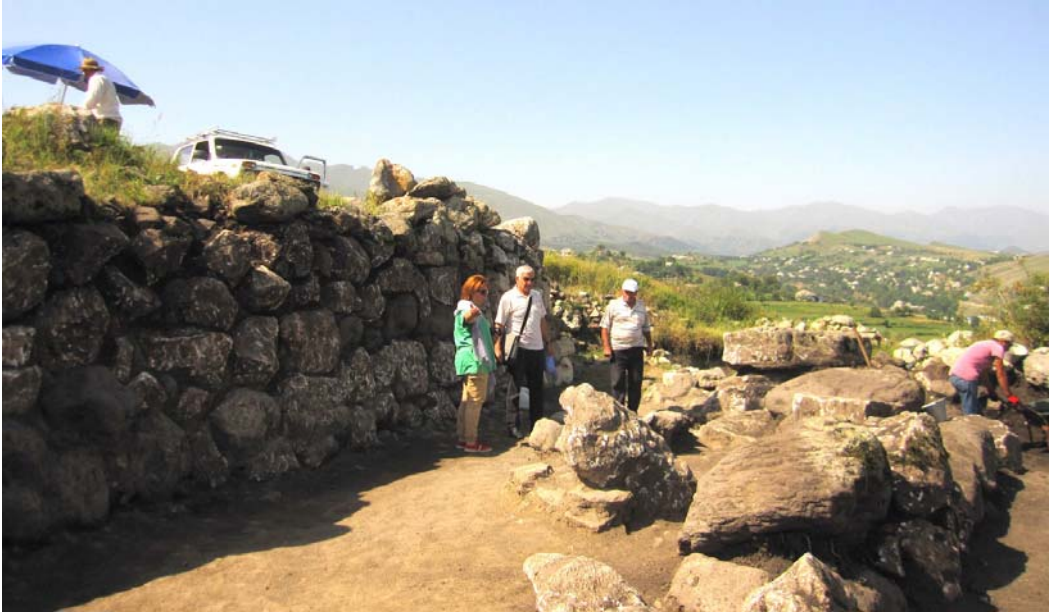
Şəkil 1. Son Tunc - Erkən Dəmir dövrünə aid qala divarları