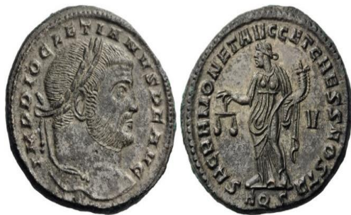
Şəkil 8. İmperator Diokletian dövründə Roma imperiyasında tədavülə buraxılan