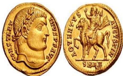
Şəkil 9. İmperator I Konstantin dövründə Roma imperiyasında