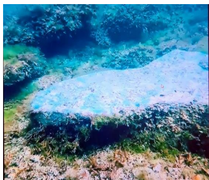
Şəkil 4. İ.Əliyevin tapıntıları.