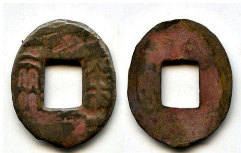
Şəkil 7. E.ə. III əsrə aid Tsinq dövləti tərəfindən tədavülə buraxılan və sonralar "vuzhu" adlanan tunc sikkələr