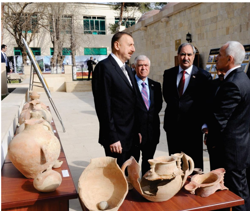
Səkil 2. Azərbaycan Respublikasının Prezidenti İlham Əliyev Salyan rayonu ərazisində yerləşən Muğan Babazanlı abidələrinin arxeoloji materialları ilə tanış olur (2013).