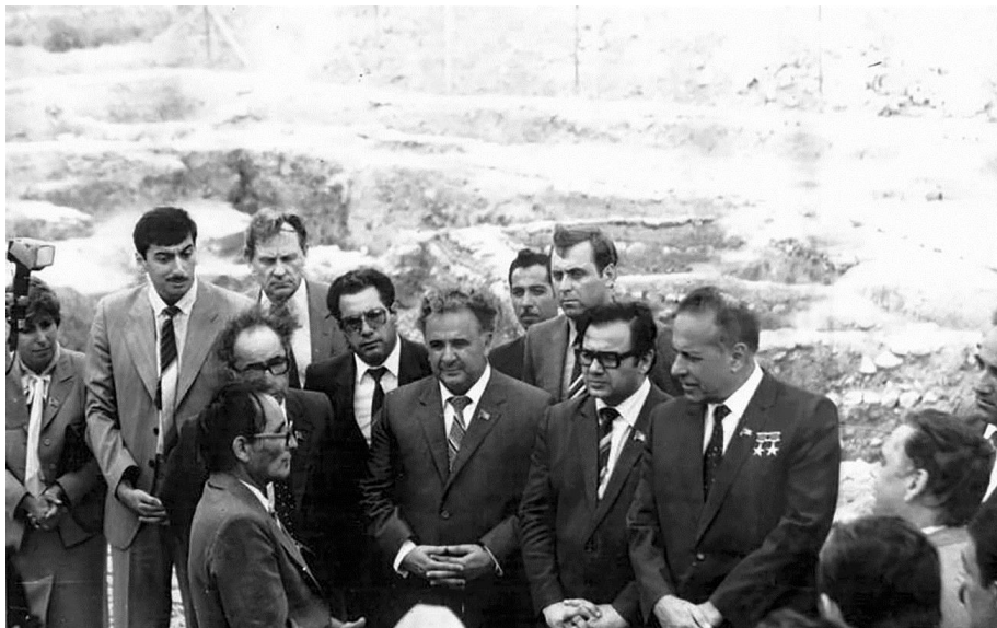
Səkil 1. Ümummilli lider Heydər Əliyev qədim Şabranda aparılan arxeoloji qazıntı işləri ilə tanış olarkən (1983).