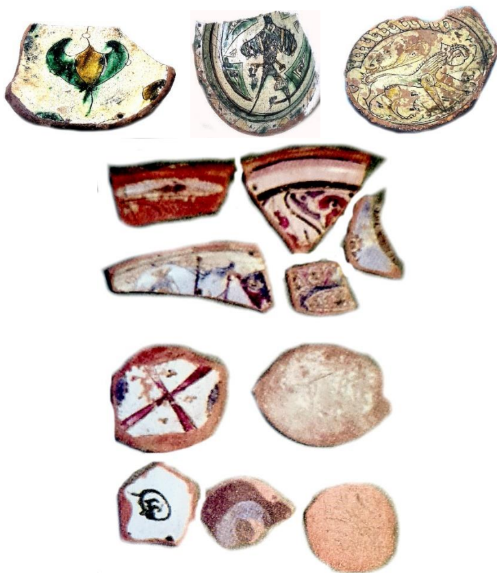
Şəkil 3. V.Kvaçidzenin tapıntıları [12, s.85]