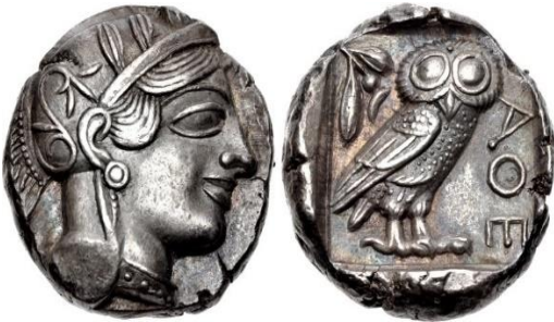
Şəkil 4. E.ə.VI əsrə aid üzərində Afina şəhərinin rəmzi sayılan bayquş və zeytun budağı təsviri olan gümüş sikkə