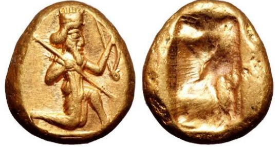
Şəkil 3. E.ə.VI əsrə aid üzərində Əhəməni imperiyasına aid rəmzlərin olduğu "darik" adlanan qızıl sikkə