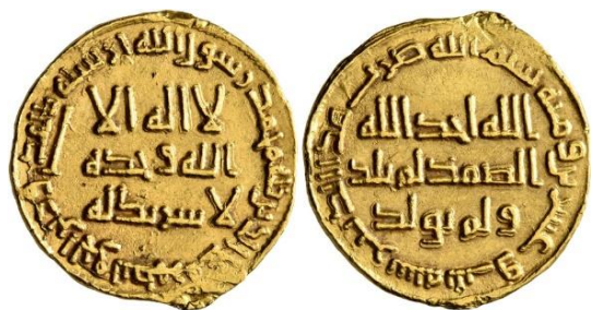
Şəkil 10. VIII əsrdə Əməvilər sülaləsi zamanı Ərəb Xilafətində tədavülə buraxılan və "dinar" adlanan qızıl sikkələr.