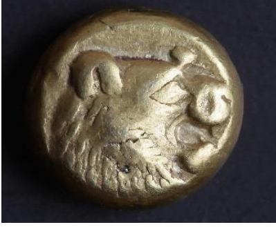
Şəkil 1. Artemis məbəbindən tapılan və üzərində aslan təsviri qabartması olan elektron monet