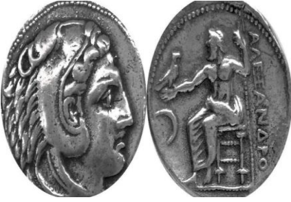
Şəkil 5. E.ə.IV əsrə aid üzərində Makedoniya imperatoru Böyük İsgəndərin