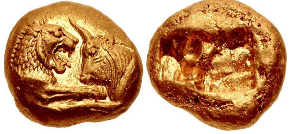
Şəkil 2. E.ə. VI əsrə aid üzərində öküz və aslan təsviri olan "krezeid" adlanan qızıl sikkə