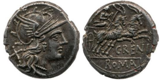
Şəkil 6. E.ə. III əsrə aid üzərində Roma şəhərinin rəmzi sayılan qoşa atlara qoşulmuş at arabası sürən savaşı təsviri olan gümüş sikkə