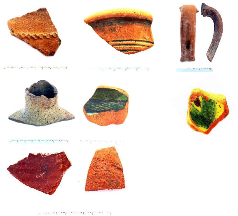
Səkil 5. 2024-cü ilin tapıntıları